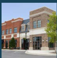
Plans de protection et de sécurité incendie